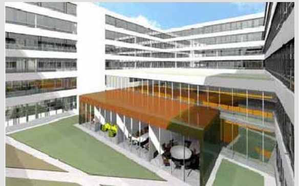
Render Gatermann+Schossig, Köln