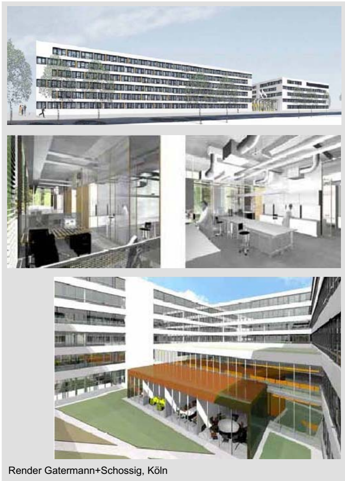
Render Gatermann+Schossig, Köln

Neubau Landeskriminalamt (LKA) NRW Völklinger Str. 49, 40221 Düsseldorf Bauherr: BLB NRW Düsseldorf Generalplanung: Hochtief Construction AG Düsseldorf Nutzung: Bürogebäude - Kriminalamt WBW-Entwurf: Gatermann-Schossig, Köln Leistungen: Wettbewerbsentwurf (2007) Genehmigungs- Ausführungsplanung Tragwerksplanung Lph. 1-9 gem. HOAI Leistungsphasen: Projektstand: Ausführungsplanung ab Dezember 2007